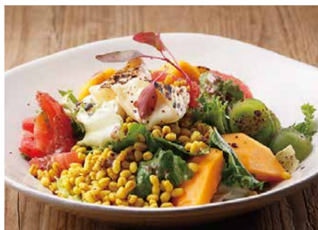
全粒穀物のブルグルとフルーツ、 カマンベールのサラダ スマックスパイスドレッシング 1680