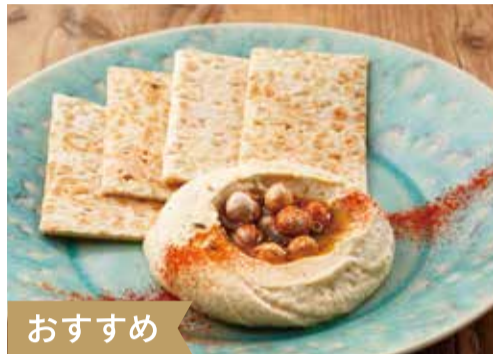
おすすめ ひよこ豆のディップ“フムス” フラットブレッド添え 700