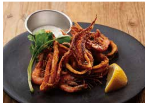
静岡県産“幸えび”と カラマリのフリット 1400