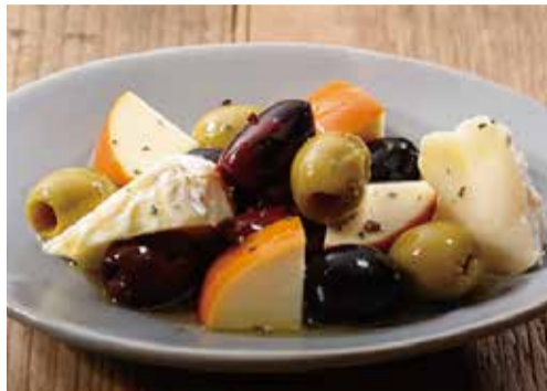
オリーブのマリネと カマンベール、スモークゴーダ 900