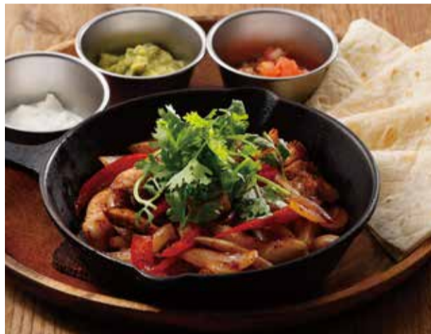
国産豚と野菜のポーク・ファヒータ 2380