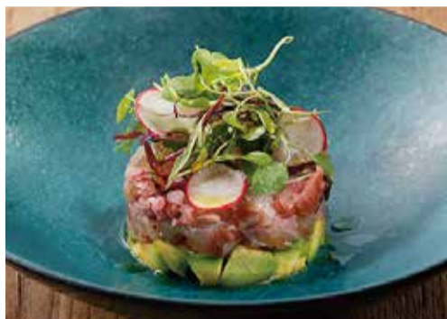
鮮魚とアボカドのタルタル 1600