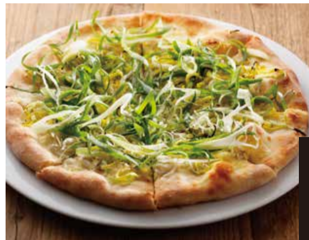
しらす、九条葱、 ポワロー葱のピザ