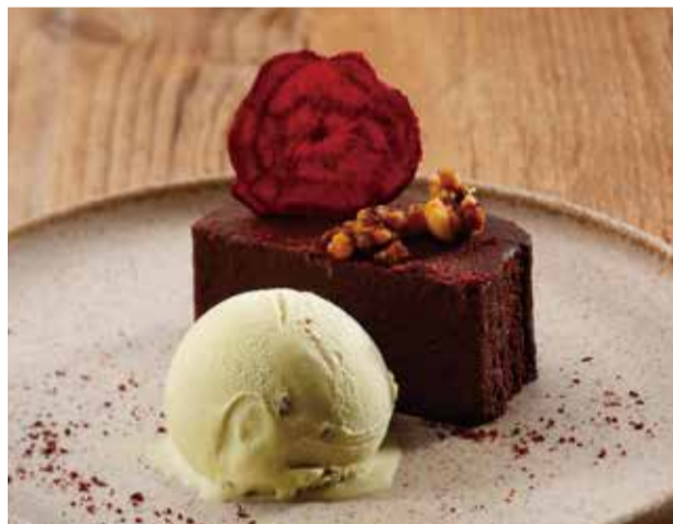
ビーツを使ったガトーショコラ 1100 ピスタチオアイス