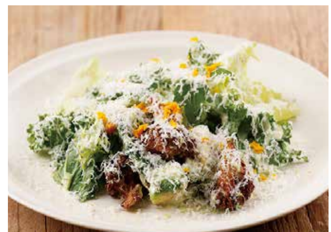
エスカロールとカリフラワー、アボガドのサラダ グリーンゴッデスドレッシング 1300