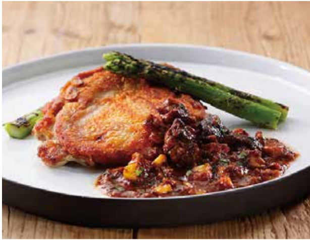
大山どりのグリル ジロール茸のスパイシーデミソース 2900