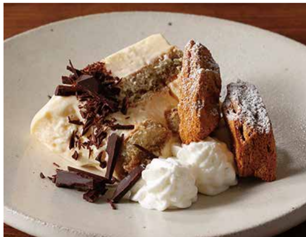
ティラミスとカルメ焼き 980 ビタースイートチョコを散りばめて