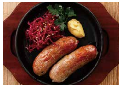
ソーセージのグリルとレッドキャベツ ディジョンマスタード添え 1100