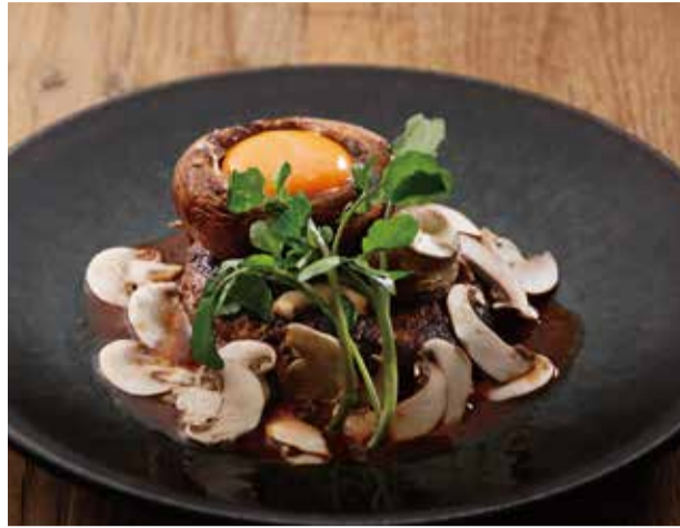
ビーフハンバーグ 2380 2種のマッシュルームとトリュフデミグラスソース