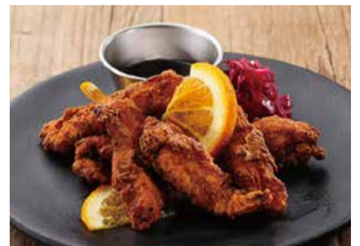
バターミルクフライドチキン オレンジソース 900