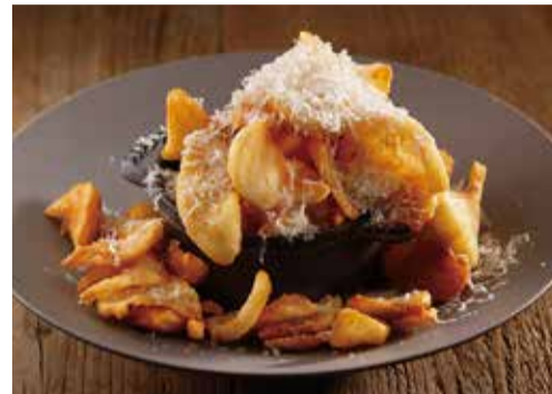
サイドウィンダーポテト トリュフソルト&パルミジャーノチーズ 1000