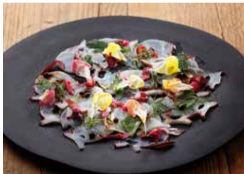
北海道産水タコと柴漬け、 山椒のカルパッチョ 880