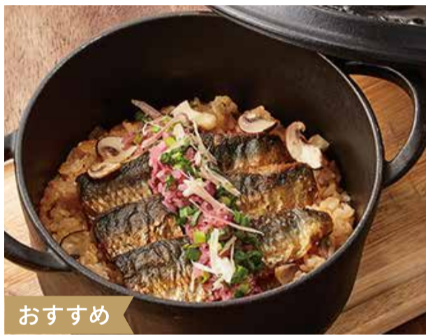
季節食材を使った ココットの炊き込みごはん