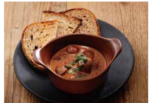
牛レバーとマッシュルーム スパイシーデミグラス煮込み 1600