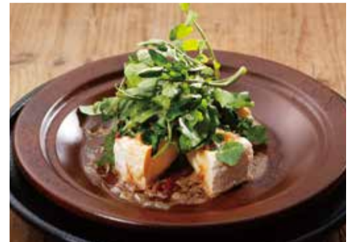
カマンベールチーズとクレソン 酒盗バターソース 1200