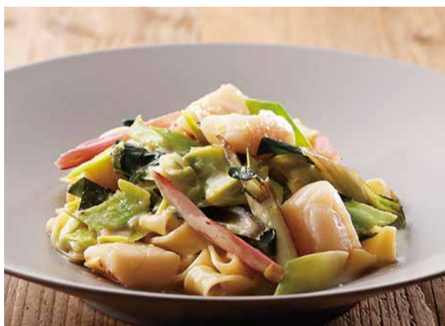
帆立とポワロー葱、スイスチャードの レモンクリーム <フェットチーネ>