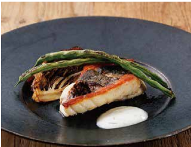
季節鮮魚のグリル 2500