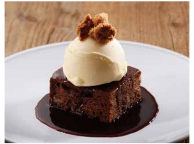
温かいトフィープディングと 980 バニラアイス