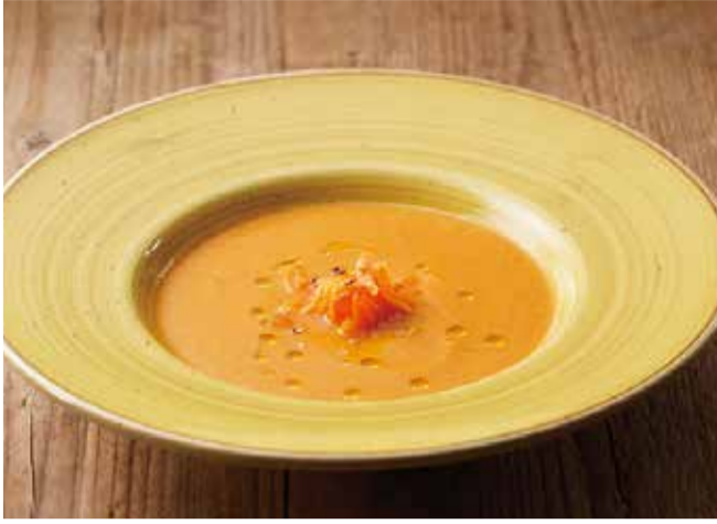
季節野菜のスープ