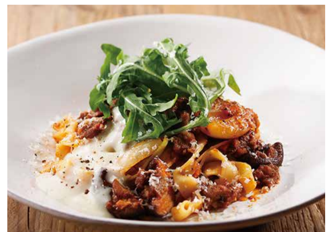
赤ワインソースで煮込んだ サルシッチャソーセージのポロネーゼ <フェットチーネ>