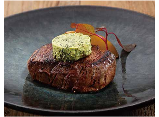
グラスフェッド牛のフィレ肉ロースト 3600