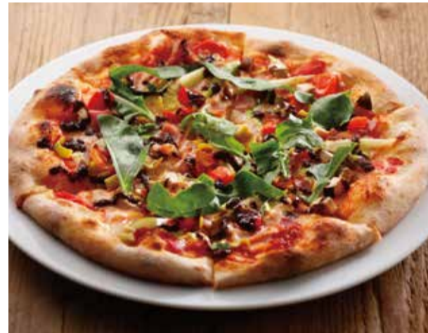
彩り野菜とベーコンのピザ