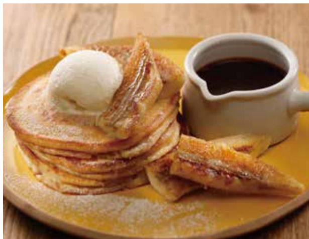
全粒粉のパンケーキ 2000 トフィーソース、バナナとバニラアイス添え