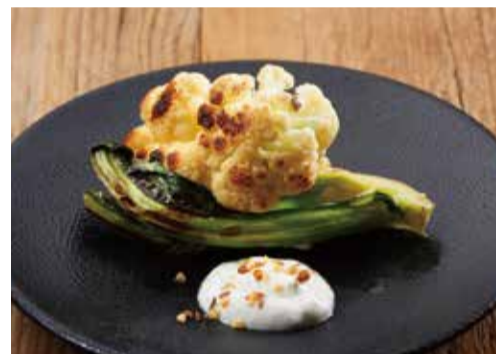
季節野菜のオープン焼き 900