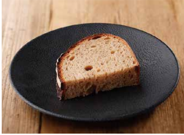
パン・ド・カンパーニュ