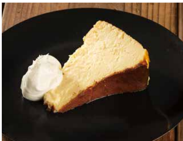
巴斯克チーズケーキ 1200 ホイップクリームとトリュフ塩