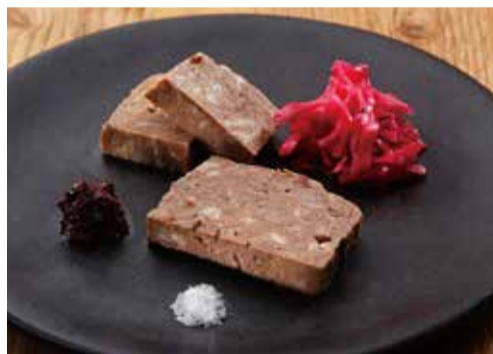
国産鹿肉のテリーヌと パテ・ド・カンパーニュ 980