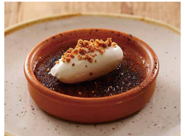
コーヒーのブリュレ 700